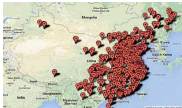
臓器収奪を行う病院のプロット図

WOIPFGは中共政府の最上級幹部—中央政治局常任委員会のメンバー5名、中央軍事委員会副主席1名、中央政治局委員1名、国防部長1名、中共解放軍兵站衛生部の元部長1名に対して（なりすましの）電話調査を行った。そのほか、臓器収奪の現場にいた目撃者、全国41の移植病院の45人の院長、主任医師、手術担当医師に対し直接に電話取材し、音声データを記録した。